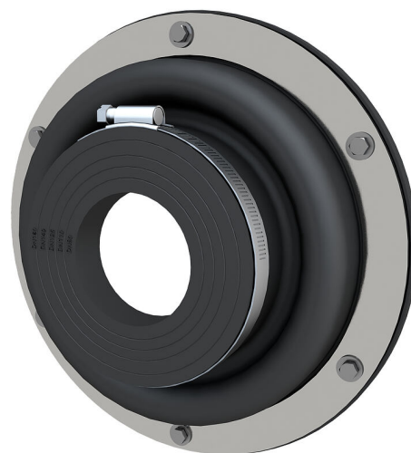
Slika može odstupati od odabranog proizvoda

Za zatapljanje krunskih provrta, lomova ili proturnih cijevi na zidovima ili prije udubljenja na limenim kućištima. Ovisno o sustavu može se stručno povezati postojeća brtva za podrum bez nepotrebnog dorađivanja. Istovremeno se pomoću istog ugradnog dijela izravno zabrtvljuje uvedene cijev za provođenje medija.