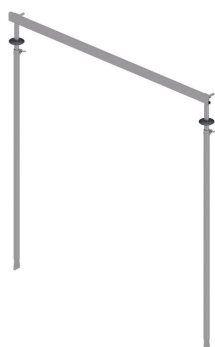
Naprava za postavljanje