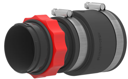
Slika može odstupati od odabranog proizvoda

Za priključivanje spiralnog crijeva Hateflex 14090 na zidnu uvodnicu ili aluminijsku prirubnicu HSI90.