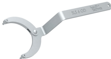
Zglobni ključ za matice s dvije rupe