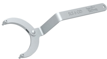
Zglobni ključ za matice s dvije rupe