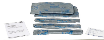
Slika može odstupati od odabranog proizvoda

Plinotijesna i vodotijesna protupožarna barijera u skladu s razredom protupožarne zaštite S90 prema normi DIN 4102-9 za ugradnju u krunske provrte odnosno plastične proturne cijevi za zidove. Brtvljenje se vrši pomoću prstenaste brtve HRD. Barijera je dopuštena za sve vrste kabela u otvorima zidova do \varnothing 300 mm.