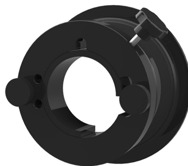
Naprava za brzo pritezanje MIS