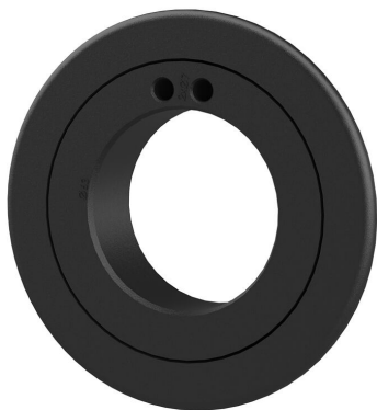
Rozeta za završetak zida