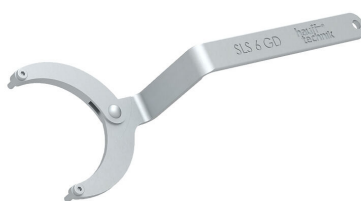
Zglobni ključ za matice s dvije rupe