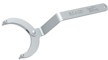
Clé articulée à ergots