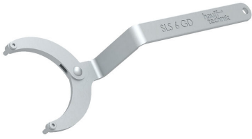
Clé articulée à ergots