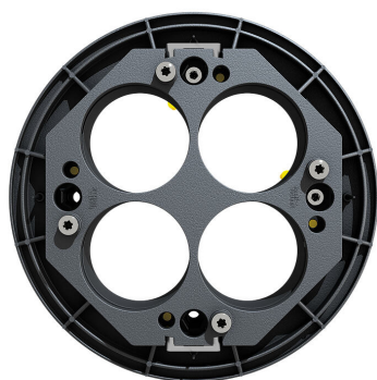
Gaine paquet de maître d'œuvre ETGAR