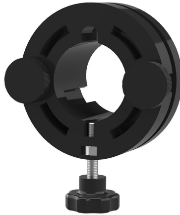
Dispositif de serrage rapide