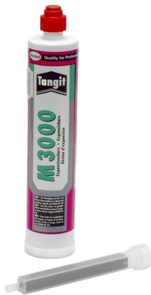
Résine bicomposant M3000