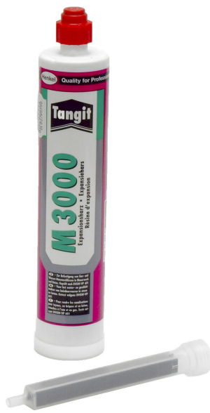
Résine bicomposant M3000