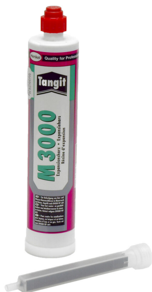
Résine bicomposant M3000