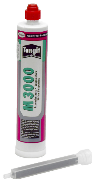
Résine bicomposant M3000