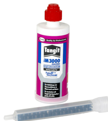
Résine bicomposant iM3000