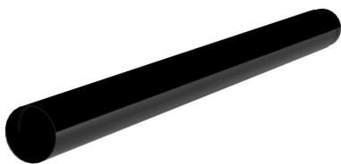
Tuyau de creusement ZAPPO