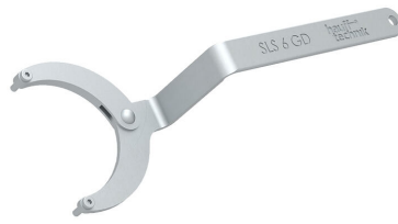
Clé articulée à ergots