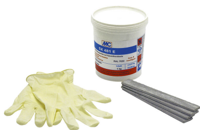
kit de montaje