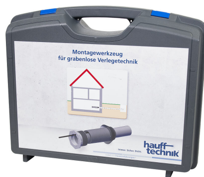
Maletín de montaje MIS NoDig