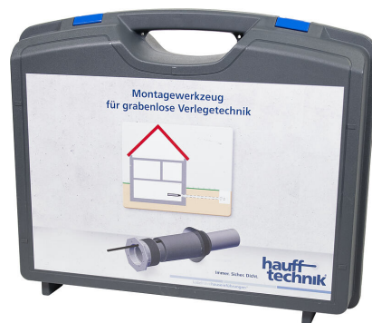
Maletín de montaje MIS NoDig