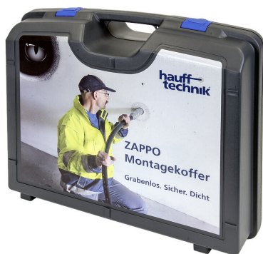
Maletín de montaje ZAPPO