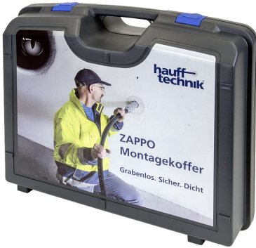
Maletín de montaje ZAPPO