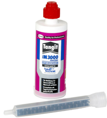
Resina bicomponente iM3000