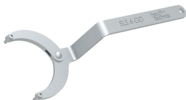
Llave de gancho articulada