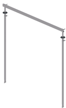
Dispositivo de ajuste