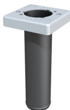
Inserto de sellado para el componente