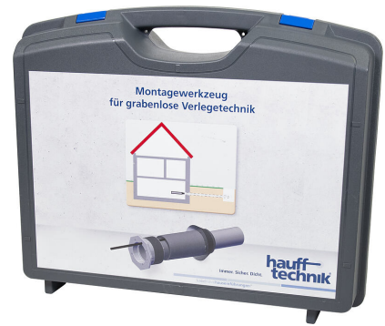
Montagekoffer MIS NoDig