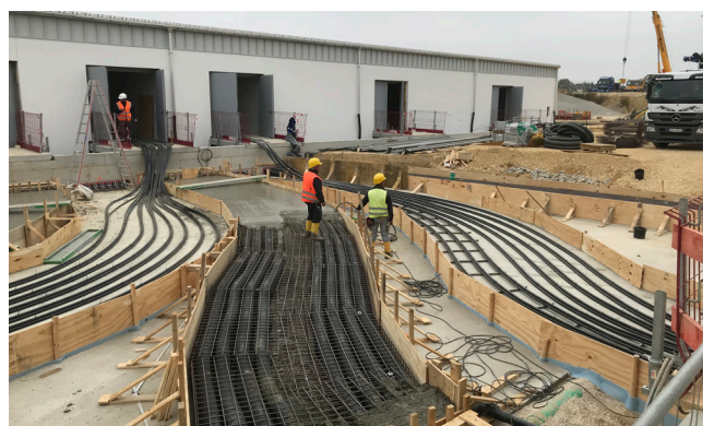
Betonggjutning på skyddsörsanslutning mellan nybyggnation och befintliga byggnader.

Knoll GmbH & Co. KG deltar på uppdrag av nätoperatören bayernets GmbH i arbetet med bygg- och anläggningsarbetet med en ny kompressorstation för naturgas i Bayern (Wertingen/Schwaben).