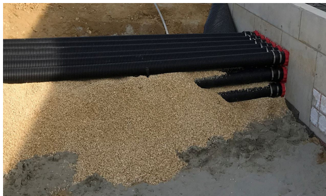
Färdigmonterade skyddsör på HSI 150-tätningsspäckningar.