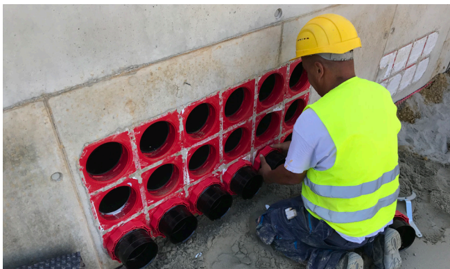
Montering av tätningsinsats HSI 150 – M168 WR för senare anslutning till vågigt kabelskyddsör.